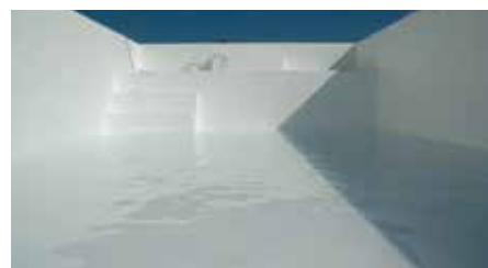
Mise en eau