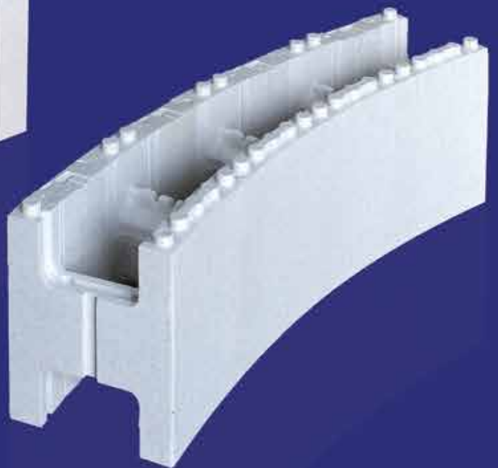
Bloc cintrable assemblé avec les entretoises