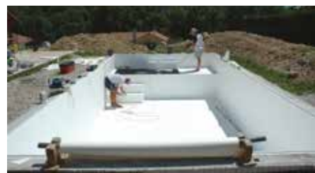
Pose du PVC armé ou liner