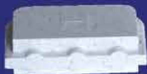
Bouchons Haut et Bas pour les extrémités