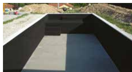
Pose du feutre murs et fond