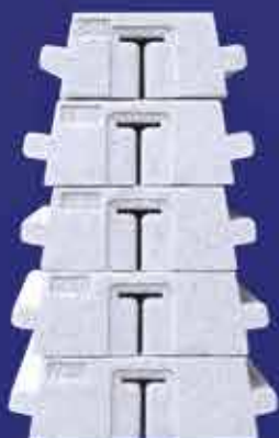
Entretoises de cintrage