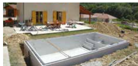
Montage de la structure polystyrène